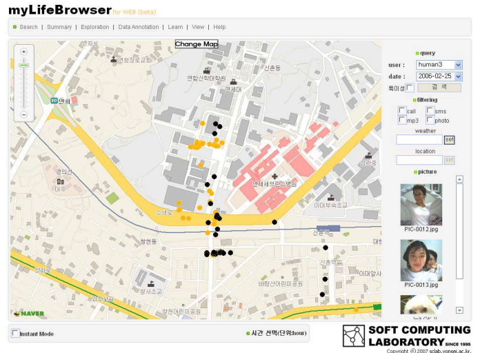
그림 11. '공부'라는 키워드로 의미 기반 검색 결과.