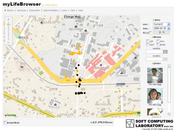
그림 10. '공부' 라는 키워드로 일반 검색 결과.

향후에는 검색 방법 및 결과에 대해 보다 넓은 도메인에서 체계적인 실험 및 평가가 필요할 것이다.